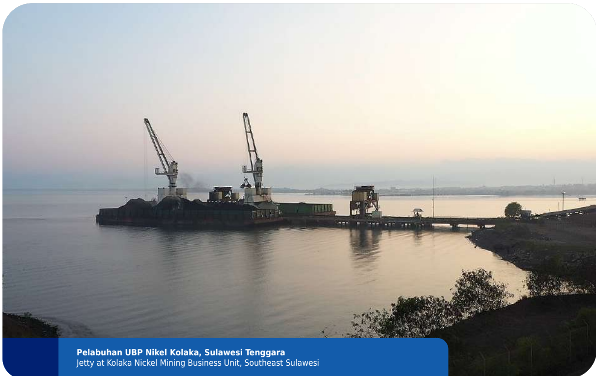
Pelabuhan UBK Nikel Kolaka, Sulawesi Tenggara Jetty at Kolaka Nickel Mining Business Unit, Southeast Sulawesi

ANTAM accelerated the completion of major downstream development projects, including the Halmahera Ferronickel Plant Development Project, the Mempawah Smelter Grade Alumina Refinery Project, and the completion of a series of cooperation transactions for the EV Battery Project.