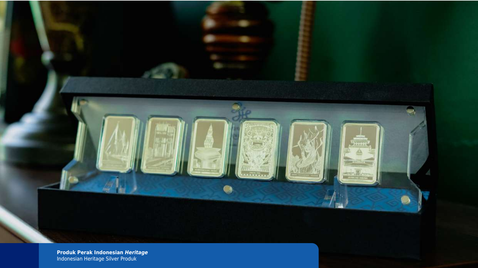
Produk Perak Indonesian Heritage Indonesian Heritage Silver Produk