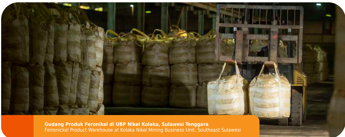
Gudang Produk Feronikel di UBK Nikel Kolaka, Sulawesi Tenggara Ferronickel Product Warehouse at Kolaka Nickel Mining Business Unit, Southeast Sulawesi

In an effort to improve sales performance, in general, ANTAM has several marketing practices that are divided into three main focuses, namely Market Brand Dominance and Distribution Scale, Service Excellence, and Product Innovation . [OJK F.26]