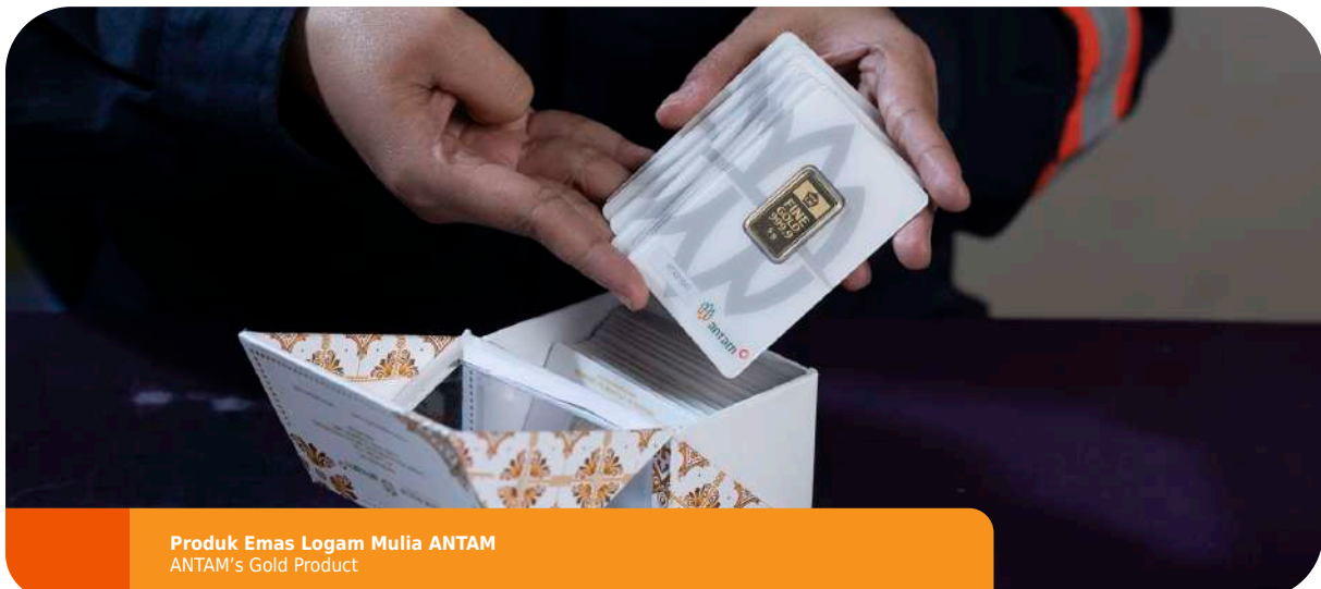
Produk Emas Logam Mulia ANTAM ANTAM's Gold Product

ANTAM uses small bar packaging with a security case made of quality materials as another sustainability measure related to product quality and safety. The packaging design is intended to be durable so that the quality of the gold bars can be protected for years. The secure card packaging used in ANTAM precious metal gold products has various security features. One of these features is a mark that appears when the packaging is opened. The mark will still be visible even if the packaging is re-glued, preventing counterfeiting attempts by irresponsible parties.